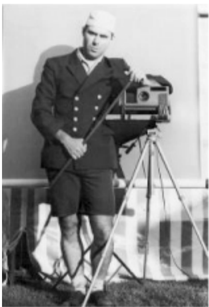
DE LA SARDINE ET DES DIAPOS

La première Soirée de l'année à l'Épidaure de Bouloire sera placée sous le signe de la Sardine et de la Bricole !