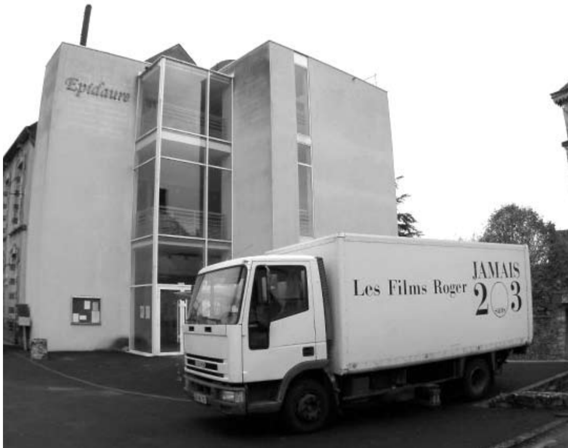
LE CAMION DES FILMS ROGER CÈDE LA PLACE À LA SALLE DE SPECTACLE APRÈS SA FOLLE TOURNÉE !

Le journal Toulemonde a donc décidé de réserver les colonnes de la présente édition mais aussi de toutes les suivantes pour vous tenir informés en exclusivité de tous les événements qui vous attendent à l'Épidaure de Bouloire, ainsi que de l'actualité de la Cie Jamais 2 sans 3, de ses créations et des activités de son Centre de Ressources Départemental Jeunes Publics «Cacophonie».